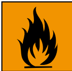
Extremt brandfarligt eller Mycket brandfarligt