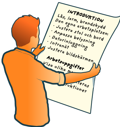
Figur 2: Checklista för introduktion.

Fördelning av uppgifter – Uppgifter inom arbetsmiljöarbetet kan fördelas på chefer, arbetsledare eller andra arbetstagare. Om ni har en delegationsordning för verksamheten kan ni lägga till uppgifter inom arbetsmiljöarbetet där. Det juridiska arbetsmiljöansvaret kan