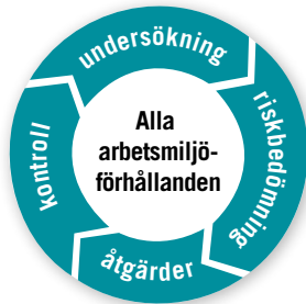
Figur 3: Centrala aktiviteter i ett systematiskt arbetsmiljöarbete.

Genom ett systematiskt arbetsmiljöarbete kan ni upptäcka risker innan något hänt, istället för att göra åtgärder efter ett tillbud eller en olycka. Med hjälp av systematiken kan ni upptäcka mer av det som är viktigt för medarbetarnas hälsa och det blir tydligt vilka åtgärder som hjälper.